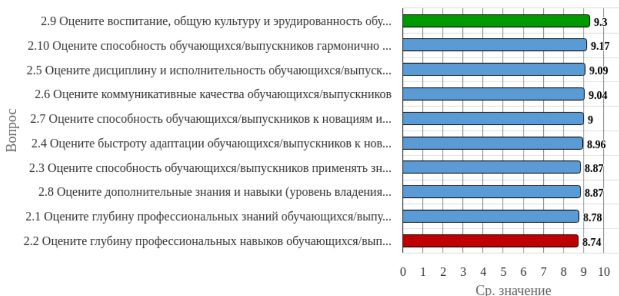
Рисунок 1.2 - Распределение показателей уровня удовлетворенности респондентов по блоку вопросов «Удовлетворенность качеством подготовки выпускников»

Индекс удовлетворенности по блоку вопросов «Удовлетворенность качеством подготовки выпускников» равен 8.98.